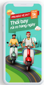
PRU-BẢO VỆ 24/7

Với người tiêu dùng, bảo hiểm phải gần gũi, dễ tiếp cận. Để đáp ứng được điều này, Prudential cũng chú trọng vào việc phát triển và cung cấp đa dạng sản phẩm bảo hiểm trực tuyến với mức phí hợp lý. Đặc biệt, khách hàng có thể mua ngay mọi lúc, mọi nơi trên sàn thương mại điện tử hàng đầu Việt Nam - Shopee hoặc ứng dụng sức khỏe Pulse by Prudential với các sản phẩm dưới đây: